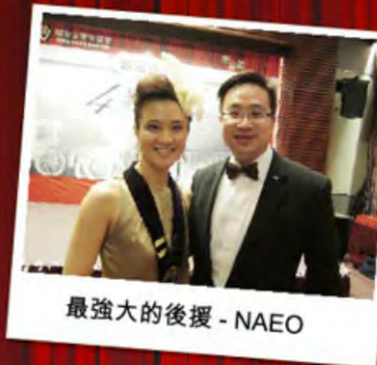
最強大的後援 - NAEO