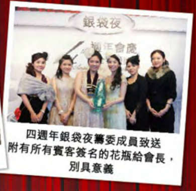
四週年銀袋夜籌委成員致送 附有所有賓客簽名的花瓶給會長， 別具意義