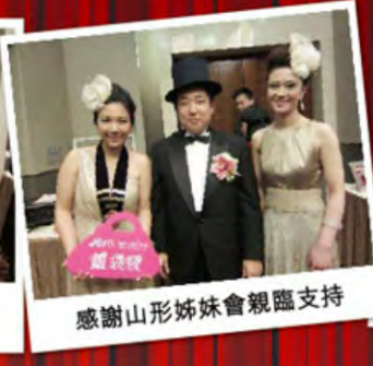
感謝山形姊妹會親臨支持