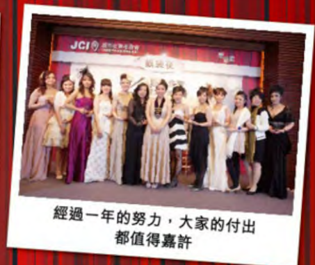
經過一年的努力，大家的付出 都值得嘉許