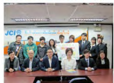
入圍青年與評審委員大合照。