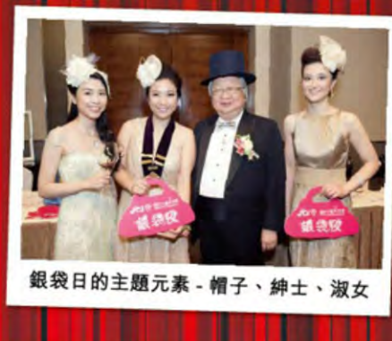
銀袋日的主題元素 - 帽子、紳士、淑女