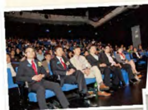
Change Maker Forum 2011 活動花絮