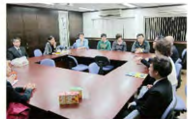
評審委員與青年人分享創業經驗。