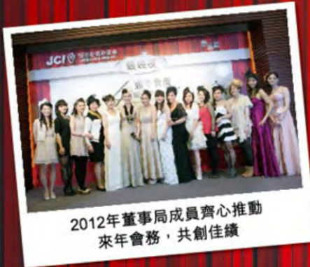
2012年董事局成員齊心推動 來年會務，共創佳績