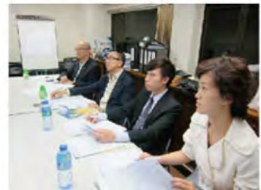
評審委員正細心評審各位青年人的面試表現。