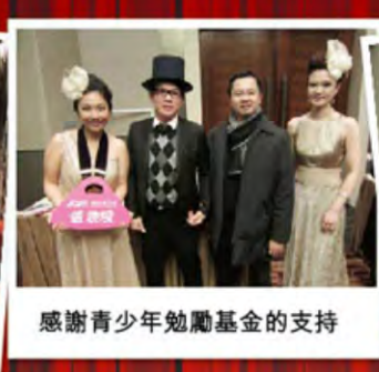
感謝青少年勉勵基金的支持